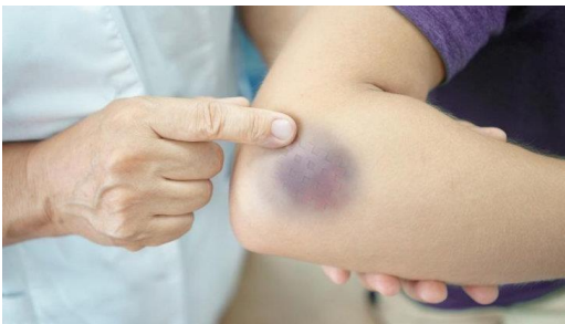
Imagen 1: Hematoma producido por caída

La medida que requiere para su tratamiento es la indicada para heridas superficiales o golpes que generen hematomas, excoriaciones, abrasiones, o erosiones. Estos accidentes requieren curaciones simples o tratamientos simples de primeros auxilios (en caso preventivo podría ser aplicación de hielo en la zona afectada, crema antiinflamatoria o parche para proteger la zona en caso de ser necesario u observar la zona afectada para ver su evolución).