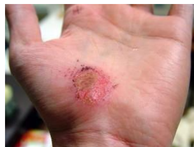
Imagen 2: Abrasión producida por roce